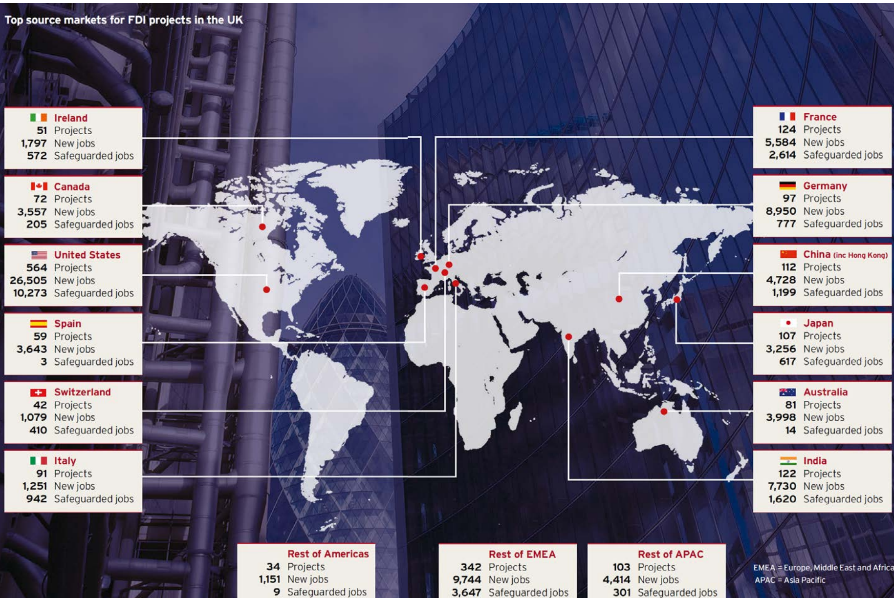
Top source markets for FDI projects in the UK